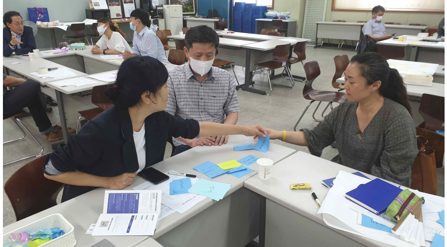
- 분과활동내용 찾기