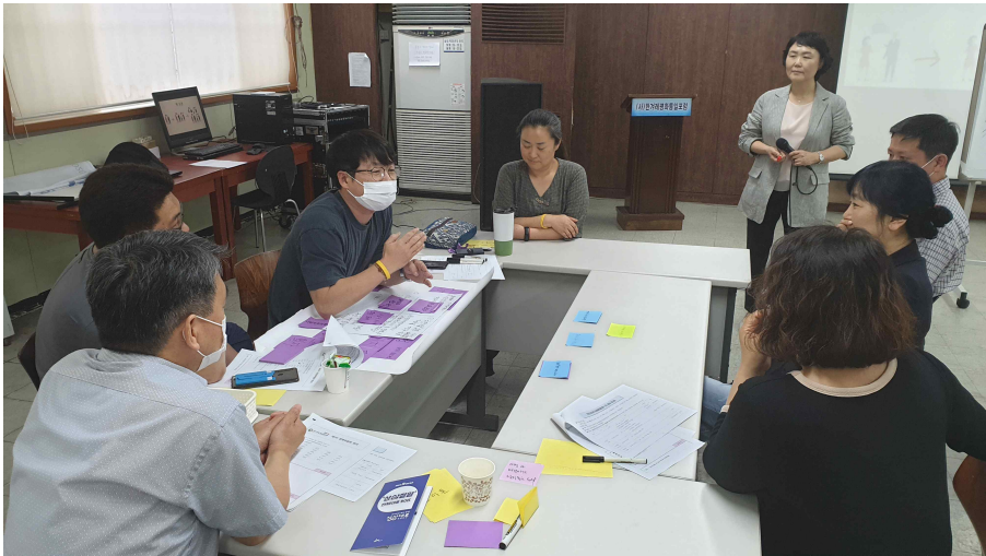
- 분과아젠다 선정