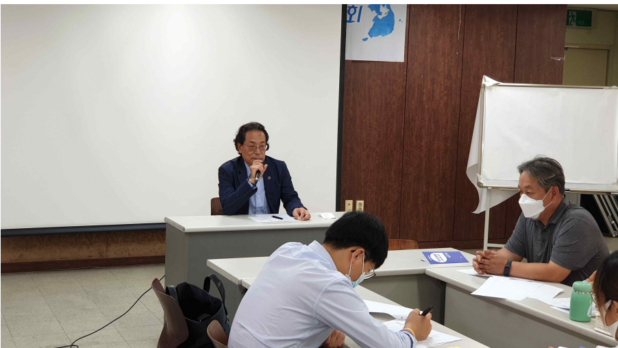
- 임원진 선출