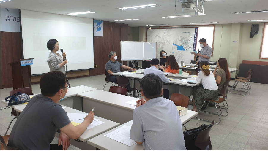
- 워크숍 안내 및 인사